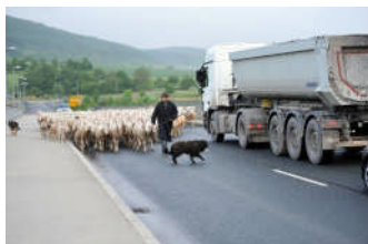
Wissen in der Tierhaltung