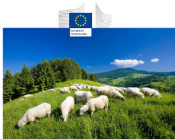
Farming for Natura 2000

Guidance on how to support Natura 2000 farming systems to achieve conservation objectives, based on Member States good practice experiences