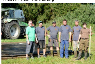
Kenntnisse zur Bewirtschaftung schwieriger Flächen