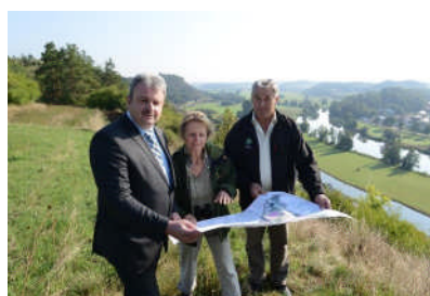
Gemeinsame Abstimmung von Maßnahmen